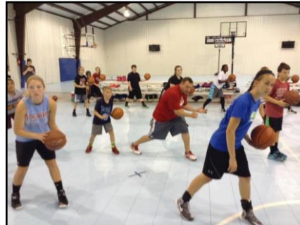
Fotografías del trabajo de la Oklahoma Basketball Academy